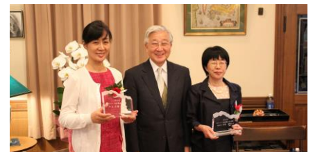
左から:羊羹・和菓子の理解を深める活動([株]村岡総本舗)、南越谷阿波踊り(ポラス[株])、「石見銀山文化賞」(中村ブレイス[株])