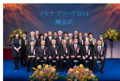
メセナアワード 2014 贈呈式