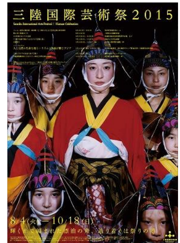
三陸国際芸術祭チラシ

趣旨に賛同くださった寄付者の皆さまとともに、被災者・被災地を応援する目的で行われる芸術・文化活動や、被災地の有形無形の文化資源を再生する活動を応援します。