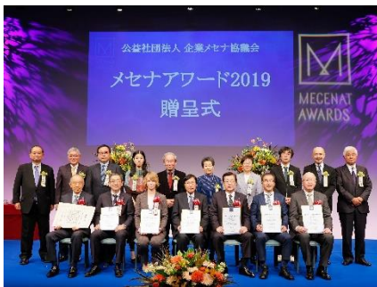
「メセナアワード2019」贈呈式の様子

●「This is MECENAT」に認定されると? : 認定活動にはシンボルである「メセナマーク」を発行します。活動に関する各広報媒体で広くご使用いただけます。認定活動はすべてTIM専用サイトにて掲載するほか、広報発信に協力をいたします。