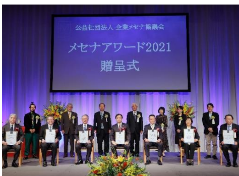
「メセナアワード 2021」贈呈式の様子