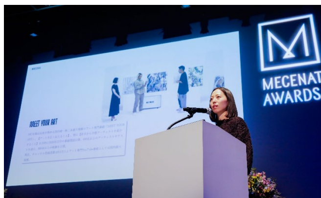
担当者による受賞活動紹介