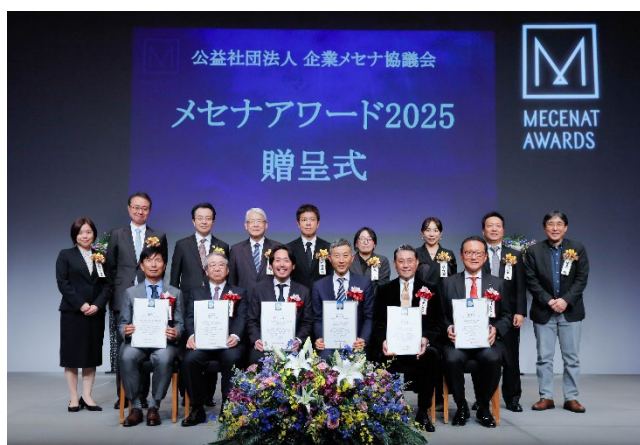
「メセナアワード 2025」贈呈式