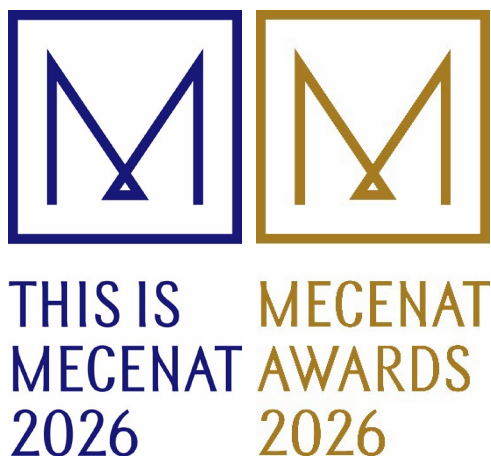
This is MECENAT 2026 / メセナアワード 2026 ロゴ