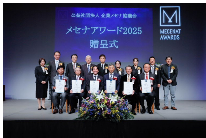
メセナアワード 2025 贈呈式