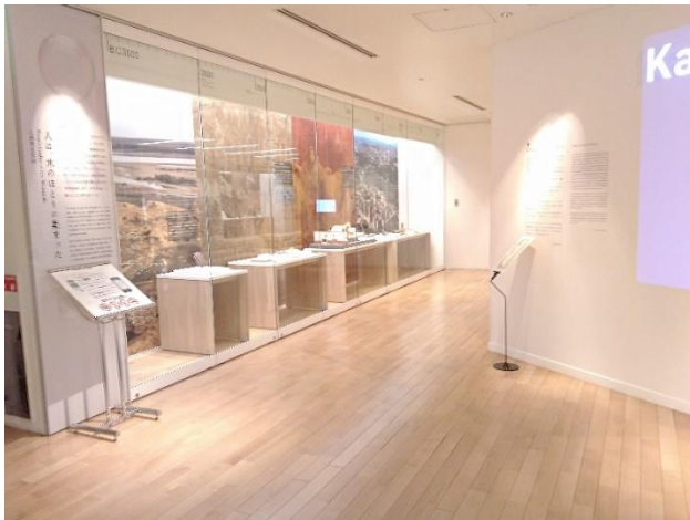
花王ミュージアム内観

花王ミュージアムは、1923年吾嬬町工場として操業を始めた現在のすみだ事業場内の一角に位置している。この年は、同社が1890年に発売した石けんの生産規模を拡大し本格的な大量生産体制を整えた時期でもある。