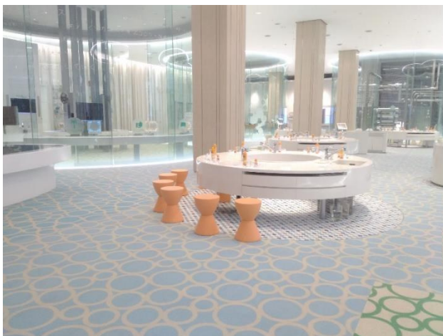
花王エコラボミュージアム内観

一方、花王エコラボミュージアムは和歌山市の和歌山工場敷地内に位置する。和歌山工場は1942年に航空潤滑油製造の目的で設立された。戦後は基幹工場として洗剤、シャンプーなど様々