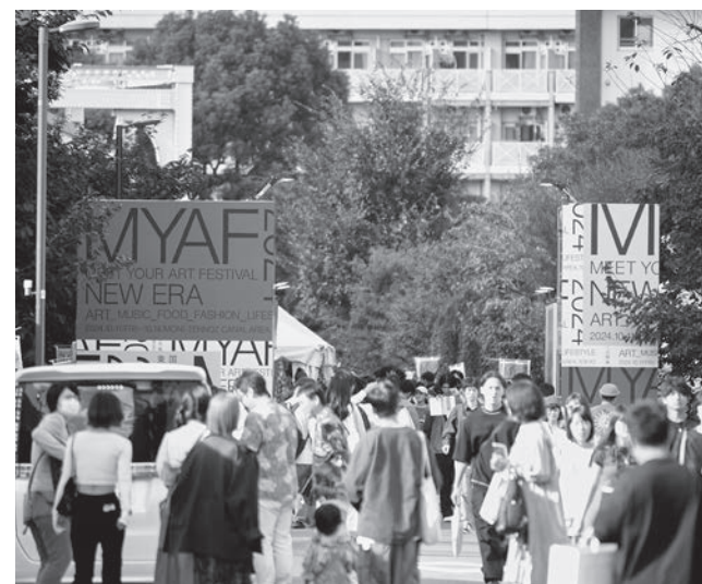
[上] 国内最大級のアート専門YouTubeチャンネル。 MCを俳優・ダンサーの森山未来が務め、累計300名以上のアーティストを紹介 [下] 国内最大級のアートフェスティバル。 2024年は150名以上のアーティストが参加し、4日間で5万人を動員

エイベックス・クリエイター・エージェンシー株式会社 企業プロフィール[2025年10月時点]