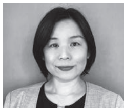
[公社]企業メセナ協議会 認定・顕彰部会長 [株]JTB ブランド・マーケティング・広報チーム 担当マネージャー

文化芸術は人々の心を豊かにし、社会に希望をもたらす力を持っています。企業のメセナ活動がこれからも発展し、文化芸術を通じたより良い社会づくりにつながっていくことを、心より願っております。