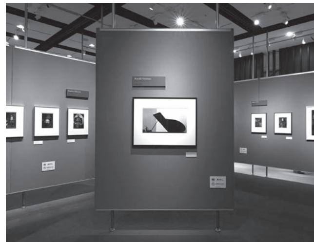
【上】「ポートフォリオレビュー／アワード」では、作品選定から展示構成、搬入作業まで、写真展開催に向けて手厚く支援する 【下】「フジフイルム・フォトコレクションⅡ」を東京・大阪で展示し、約3万8,000人が来場した