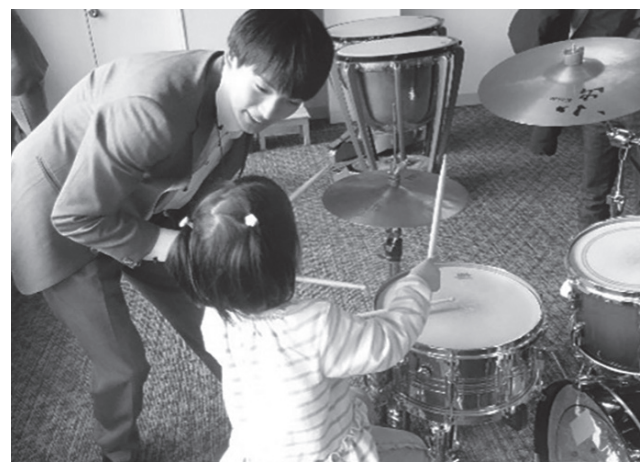
【上】音楽イベントの参加のほか、ブリヂストン工場所在地で定期的に演奏会を開催