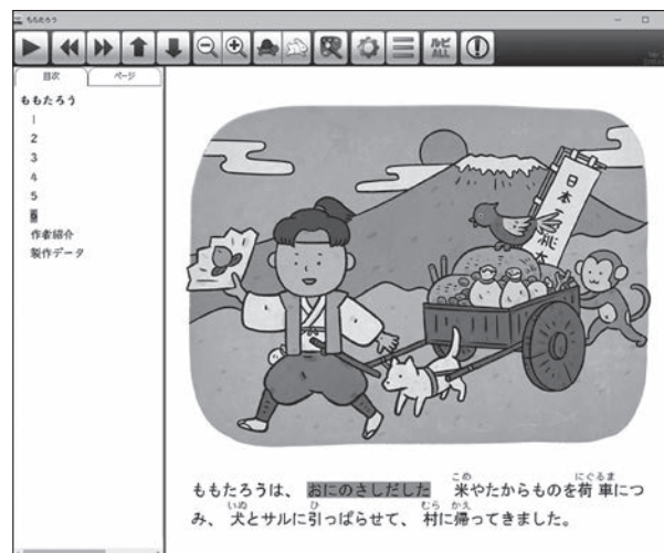
【上】「子ども文庫助成事業」『子どもの本100冊助成』受領団体の図書お披露目会の様子（朝里川あじさい町会 あじさい文庫／北海道） 【下】『電子図書普及事業』マルチメディアDAISY図書『わいわい文庫』（Ver.BLUE『ももたろう』文：浜なつ子 絵：よこやまようへい）