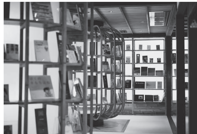
[上] オペラハウス「大森座」。最大収容人数70名ほどの小さなホールには、定期的に開かれるコンサートに住民をはじめ多くの来場者がある [下] 「石見銀山まちを楽しくするライブラリー」。島根県立大学のサテライトキャンパス機能も持ち、地元になくはならない存在となっている