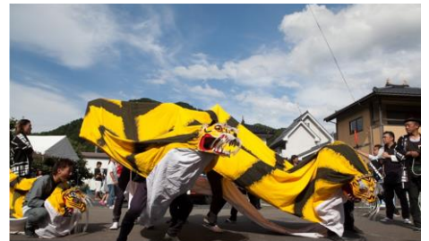
大槌・向川原虎舞復興プロジェクト(岩手)