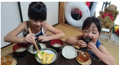
「丸尾三兄弟 OO(マルオ)の食卓」展(熊本)

※レジリエンス…心理学や精神医学にて、精神的回復力、復元力、自発的治癒力といった意味でつかわれる言葉。