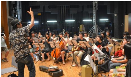
「フェスティバル FUKUSHIMA!2014 納涼! 盆踊り」を中心とした「プロジェクト FUKUSHIMA!」の活動(福島)