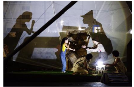
2016年度中川運河助成 ARToC10 採択事業 「月灯りの移動劇場」ビエールミロワール

リンナイ株式会社/ 中川運河再生文化芸術活動助成事業 (中川運河助成 ARToC10)への支援