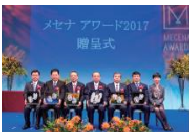
「メセナアワード 2017」贈呈式の様子